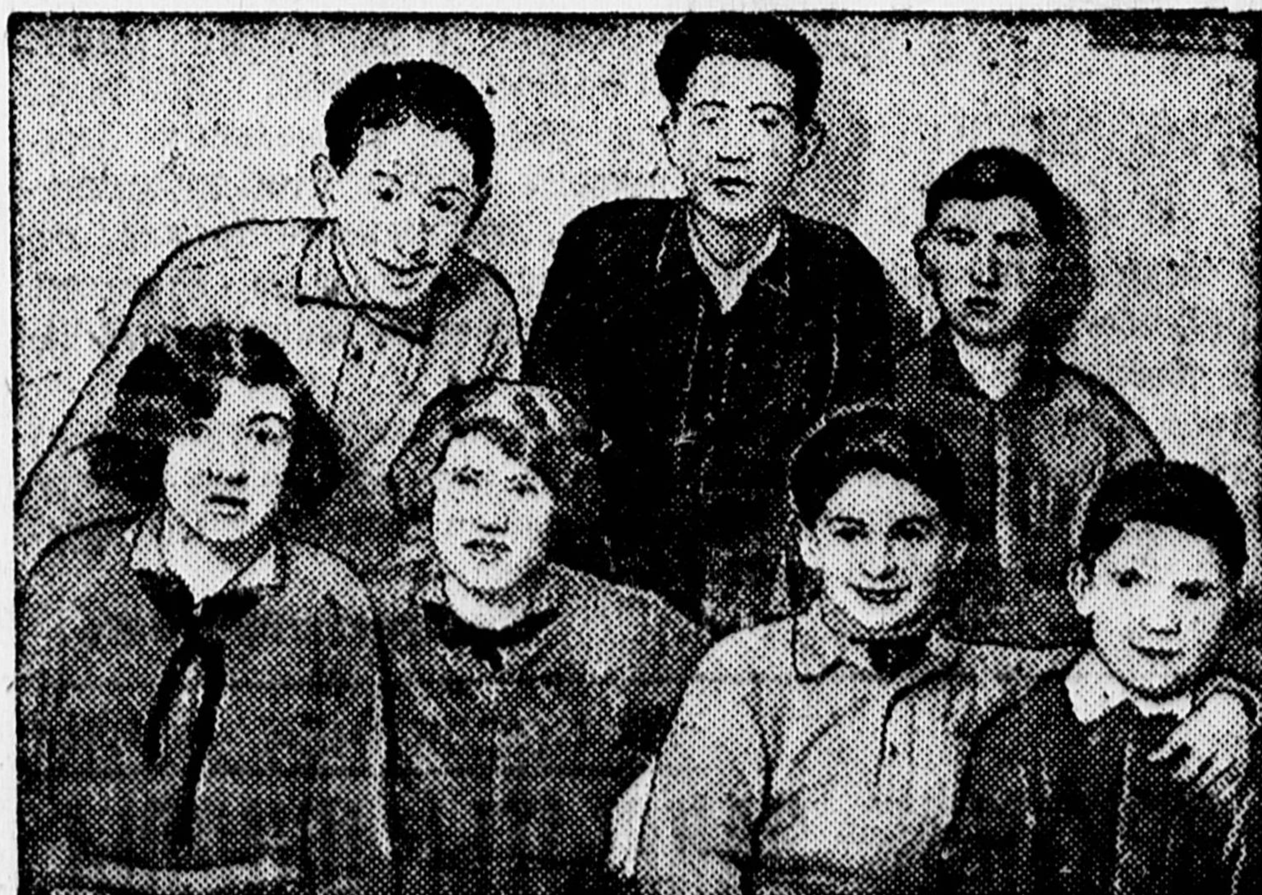
Активисты литературной и театральной бригад «Пионерской правды», едущие в Ленинград для обмена опытом культурно-массовой работы.

Румяные ребята мчатся на буерах. Веселые лыжники едут за город. База 5-го дня отдыха привлекает сотни детей. В большом зале Дома культуры, где бьют фонтаны, где зелень и цветы окружают школьников, весь день проводятся массово-подвижные игры. Кружок проводов здесь задает тон. Физкультурно-оздорови-