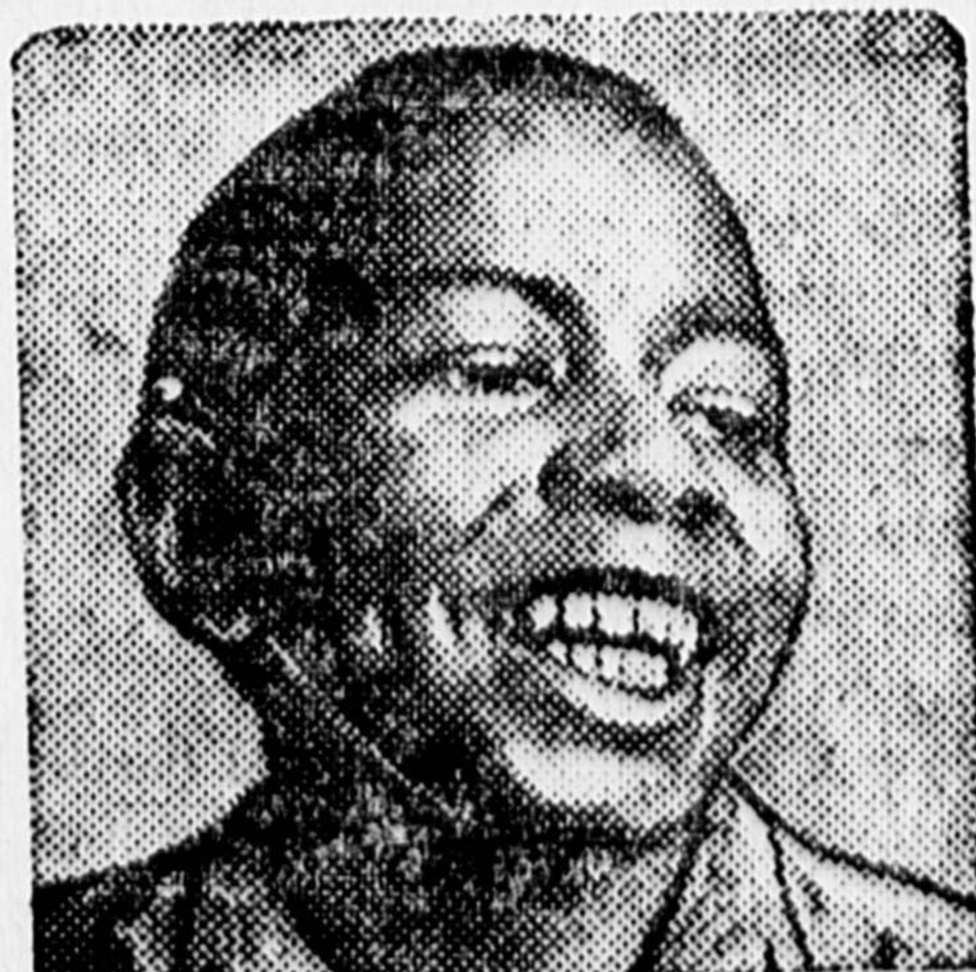
Джон... — пионер, ученик школы им. Радищева (Москва).

Консультацию по вопросам фото дает журнал «ЗНАНИЕ — СИЛА», Новая площадь, д. 6.