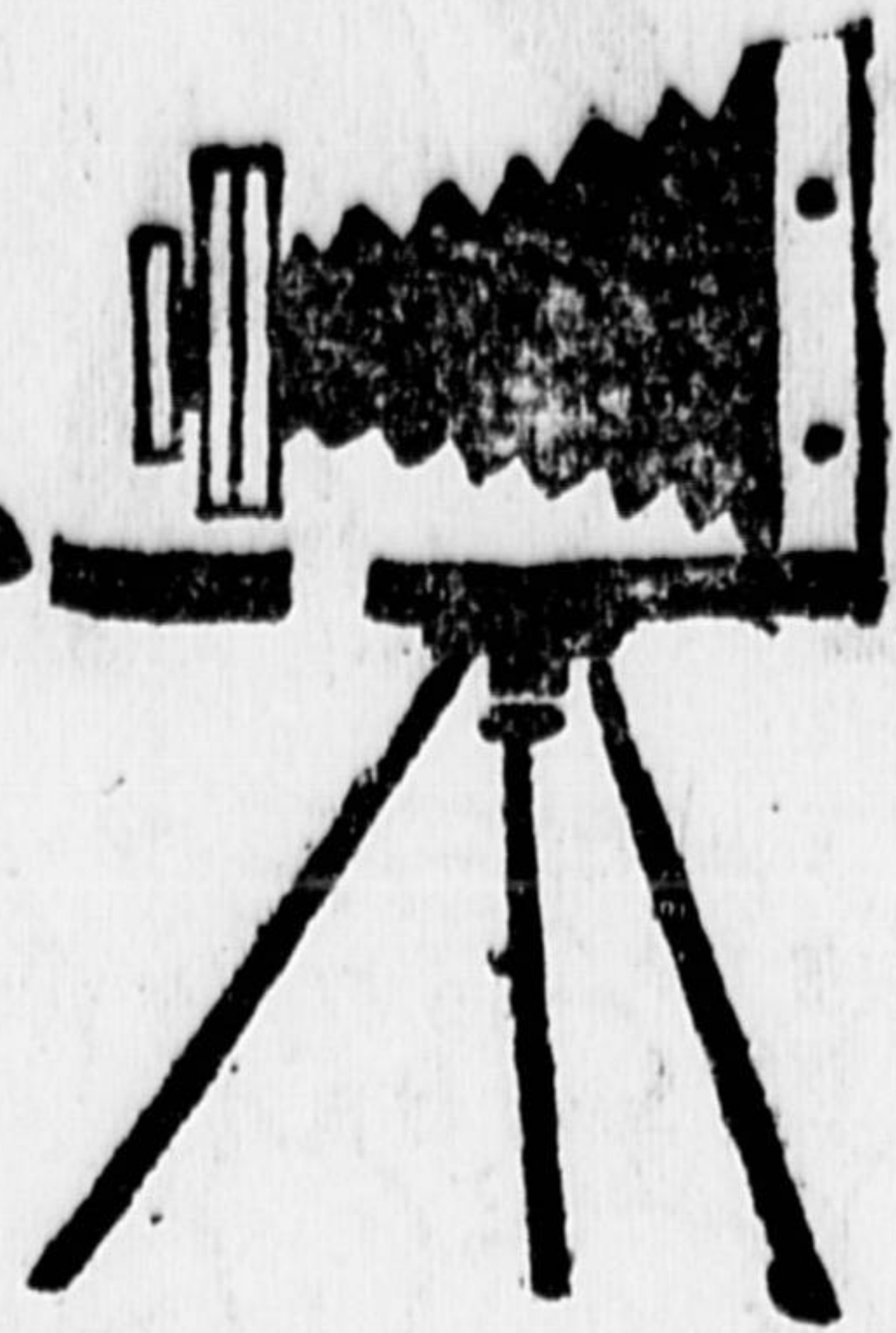
ОБЗОР ДЕТСКИХ ФОТО

Фотолюбителей - одиночек надо организовать. Им нужна помощь, им нужны материалы для работы. Их работу нужно направить.